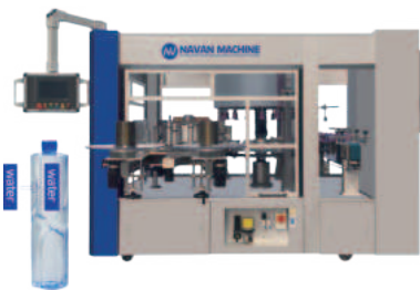
Машина для этикетования