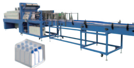
Упаковочная машина в термоусадочную пленку