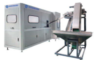
Машина для выдувания бутылок