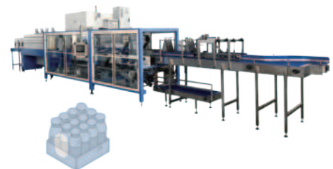
Машина для упаковки на паллетареты