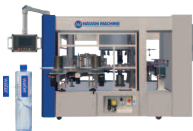
Машина для этикетования