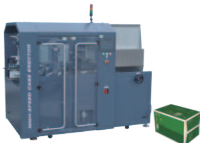
Машина для формирования картонных коробок