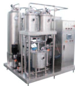
Карбонатор / Смеситель CO 2